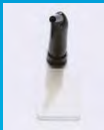
Tono translúcido del composite 3M™ Filtek™ Supreme XTE Universal