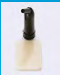
Principal composite de la competencia